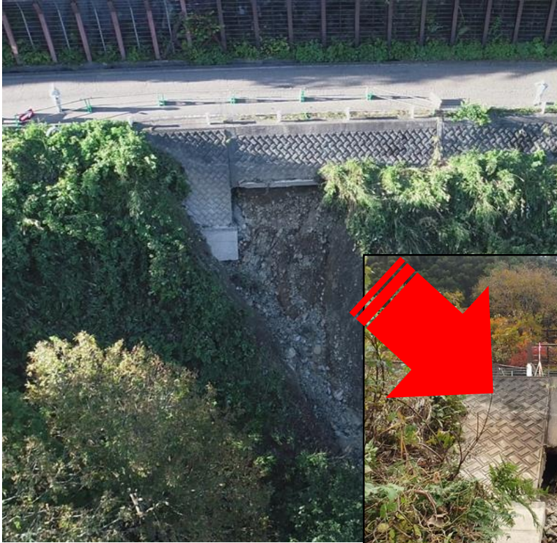
国道400号博士峠 会津美里町松坂地内 （博士沢1号）