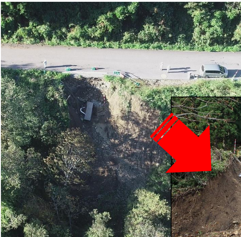
国道400号博士峠 会津美里町松坂地内 （博士沢2号）