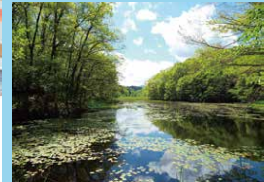
▲日本で2番目に古い矢ノ原湿原