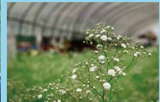
▲夏の高原の気候に適したかすみ草