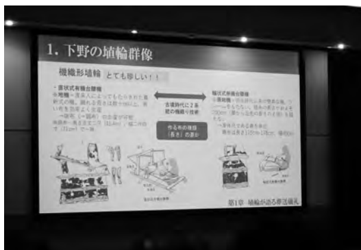
甲塚古墳の機織埴輪